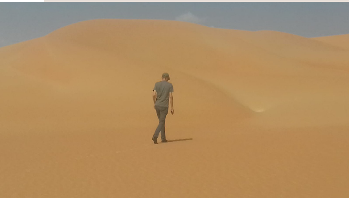
Dans le désert d'Abu Dhabi, en septembre 2019